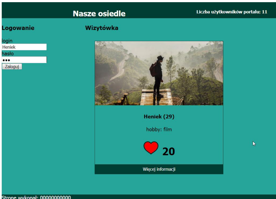
Obraz 2. Witryna internetowa, strona uzytkownicy.php , zalogowano do konta o loginie Heniek