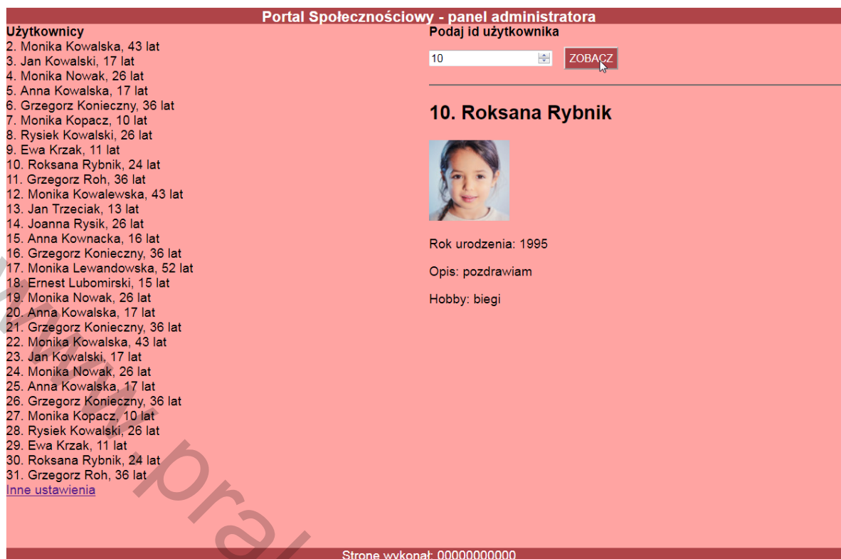
Obraz 2. Witryna internetowa, strona users.php , podano wartość 10 w formularzu i zatwierdzono